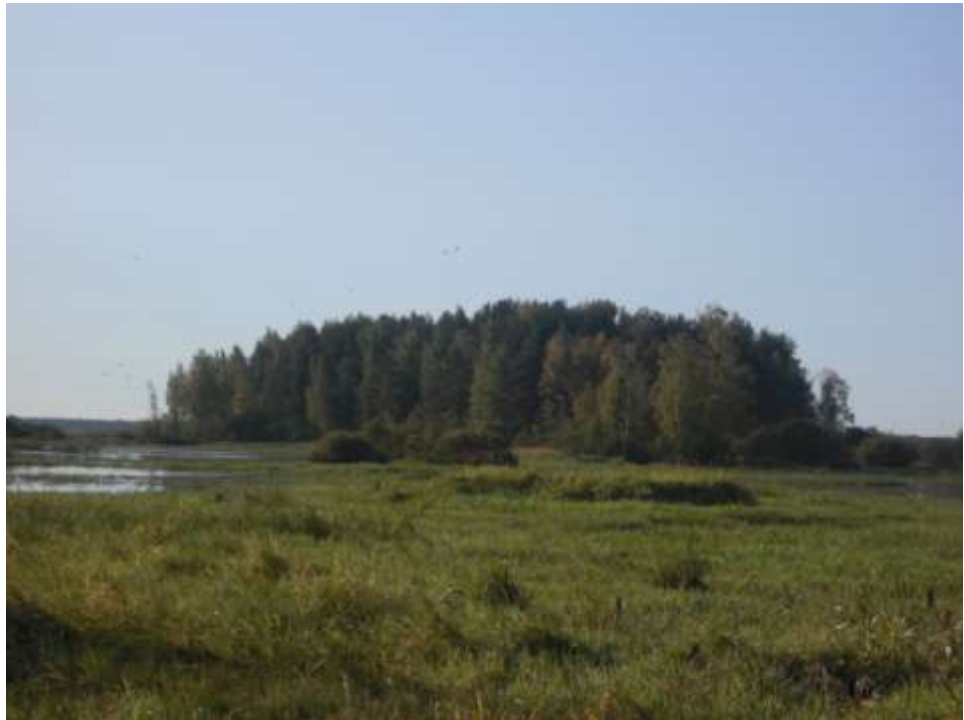
Остров Сосновик, где, по преданию, находилась усадьба помещика – отца Нинели.