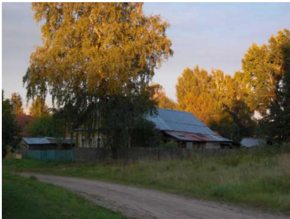
Бывшая совхозная контора (ныне дом Светланы Фадейковой)