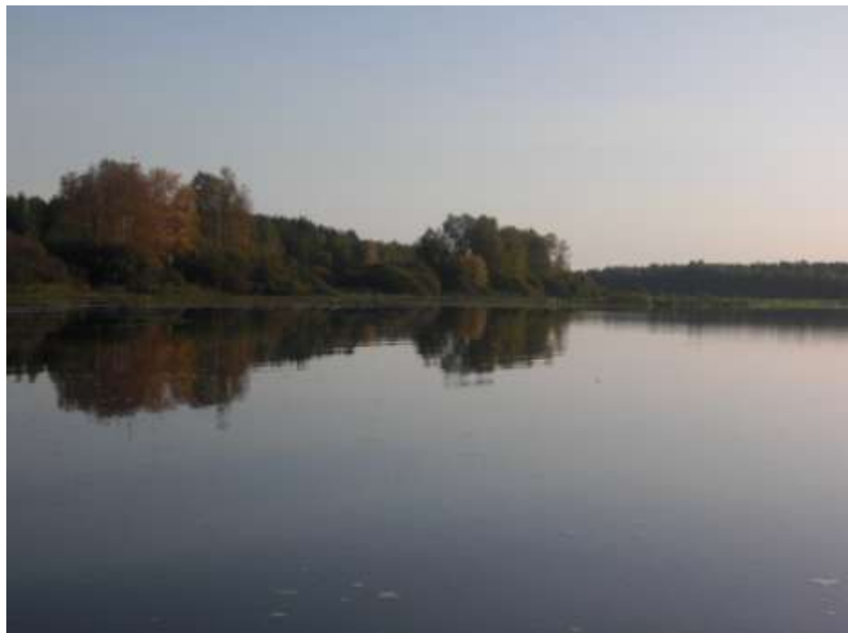
Разливы реки Колоденки