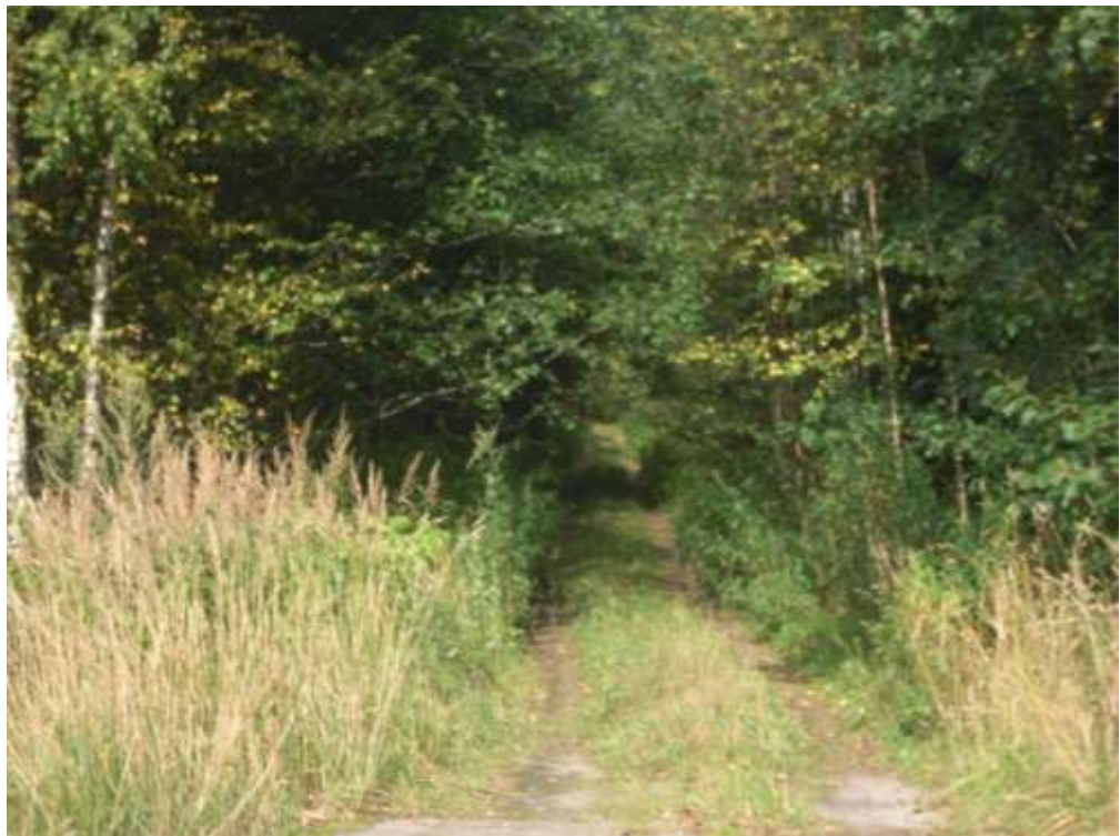
Фото с места, где проходила узкоколейная железная дорога.