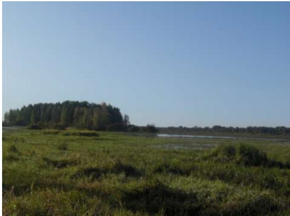
Вид на место, где могла быть Нинелена купальня.