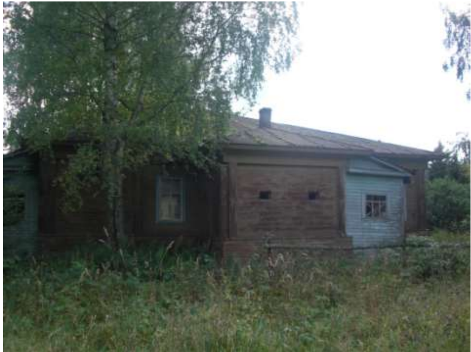
Дмитриевская восьмилетняя школа.