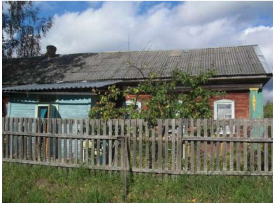
Интернат для девочек (современный вид), здание интерната для мальчиков не сохранилось