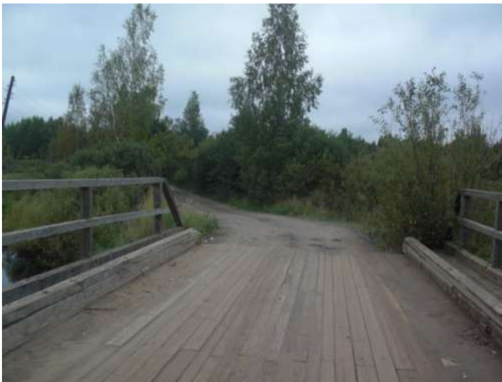
Современный вид моста через реку Колоденку.