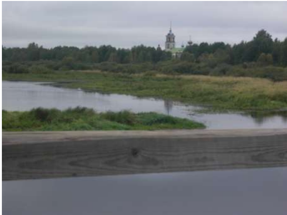
Вид на реку Колоденку с Тиманского моста