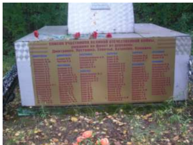
Обелиск павшим в боях за Родину в Великой Отечественной войны