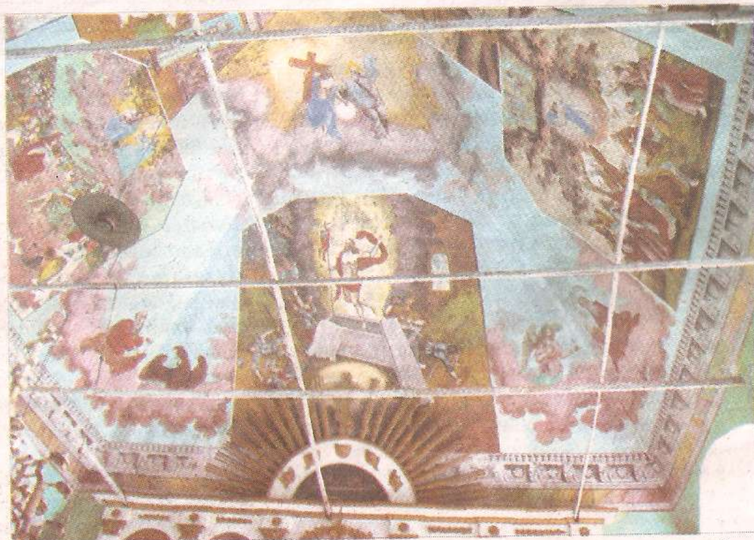
По мнению ведущих реставраторов, росписи верхнего придела дмитриевской церкви входят в золотой фонд древнерусской живописи.