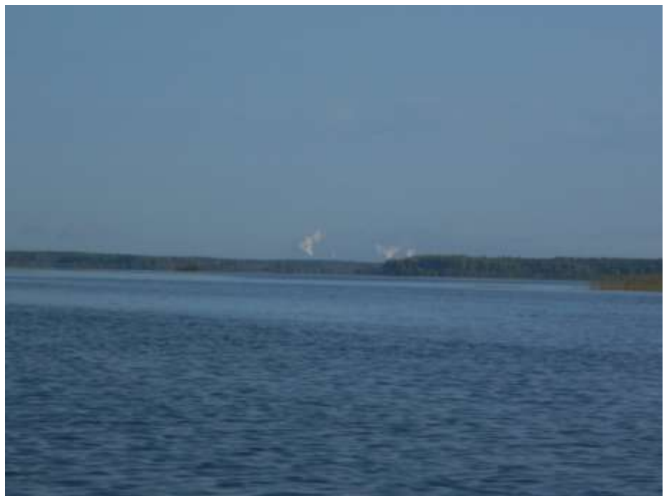
В ясную погоду, находясь на реке Колоденке, можно увидеть трубы череповецкого комбината.