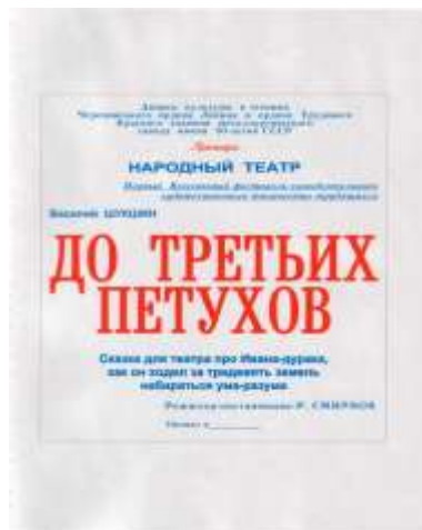
Афиша спектакля «До третьих петухов».