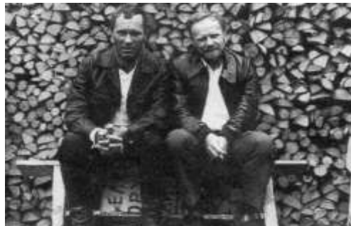
В.М.Шукшин и В.И.Белов в Белозерске, во время съемок фильма «Калина красная»