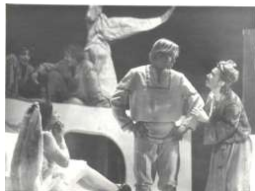
В избушке Бабы-Яги. На переднем плане (слева направо): Дочь Яги (С.Нафикова), Иван-дурак (Б.Леньков), Баба-Яга (Л.Киселева).