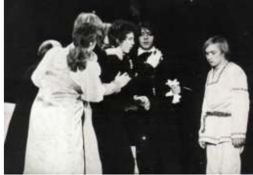
Заключительная сцена в библиотеке. «Целую печать принес!» . На переднем плане (слева направо): Онегин (А.Меньшиков), Ленский (С.Васильев), Иван-дурак (Б.Леньков).