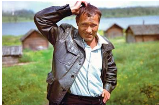
В.М. Шукшин на съемках фильма «Калина красная»