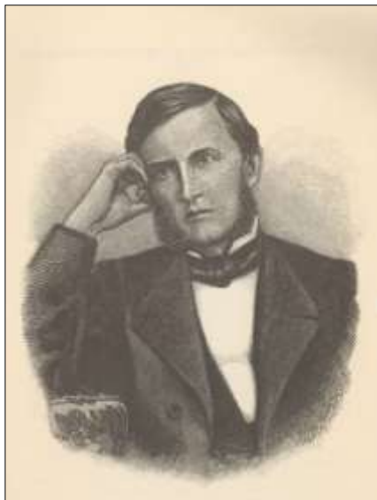
Рис. 9. Ушинский Константин Дмитриевич