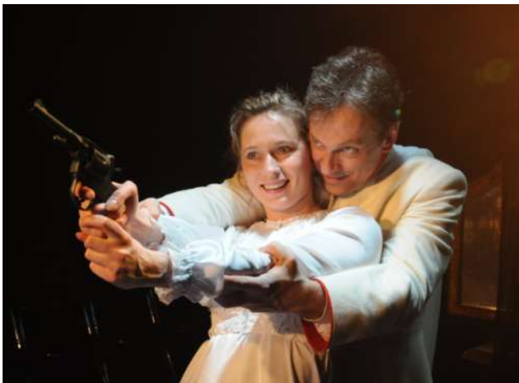
25.Ф.М.Достоевский «Кроткая» (2008 г.). Фрагмент спектакля.