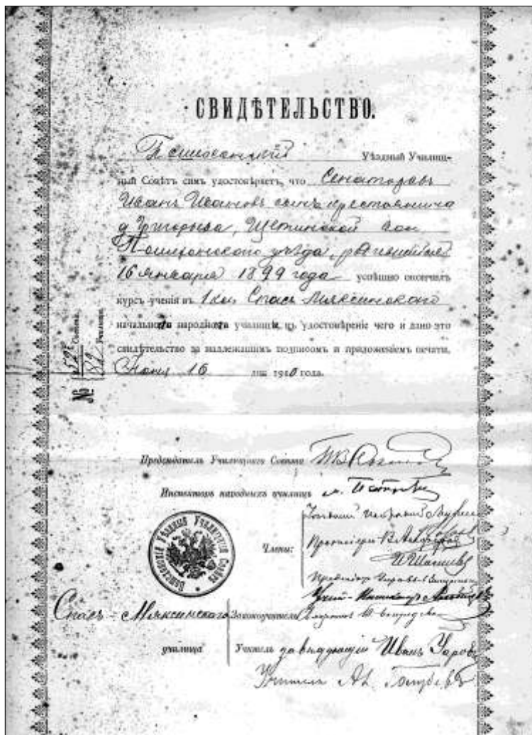
Похвальный лист ученика 2 класса от 1 июля 1913 года