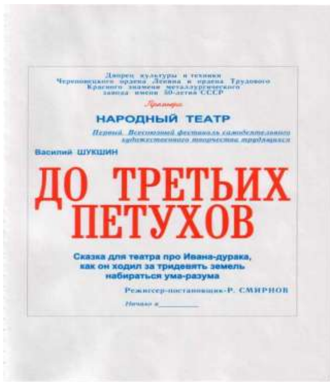
3. Афиша спектакля «До третьих петухов». Воссоздана средствами компьютерной графики.