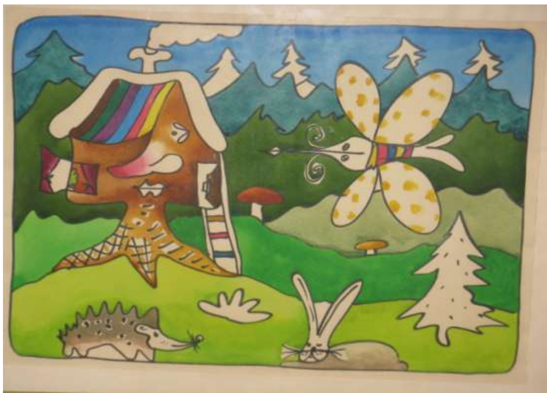
10. А.С.Абрамов «Лесная сказка». Бумага, фломастеры.