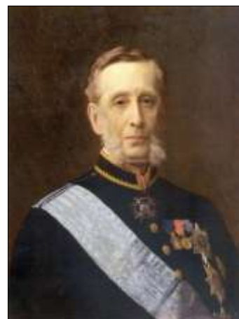
Рис. 6. Валуев Пётр Александрович