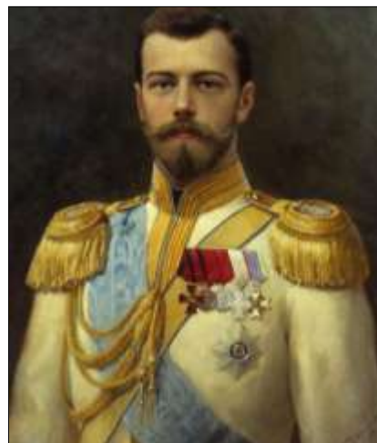
Рис.2. Николай Второй.