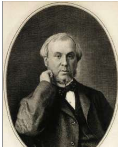
Рис. 8. Милютин Николай Алексеевич