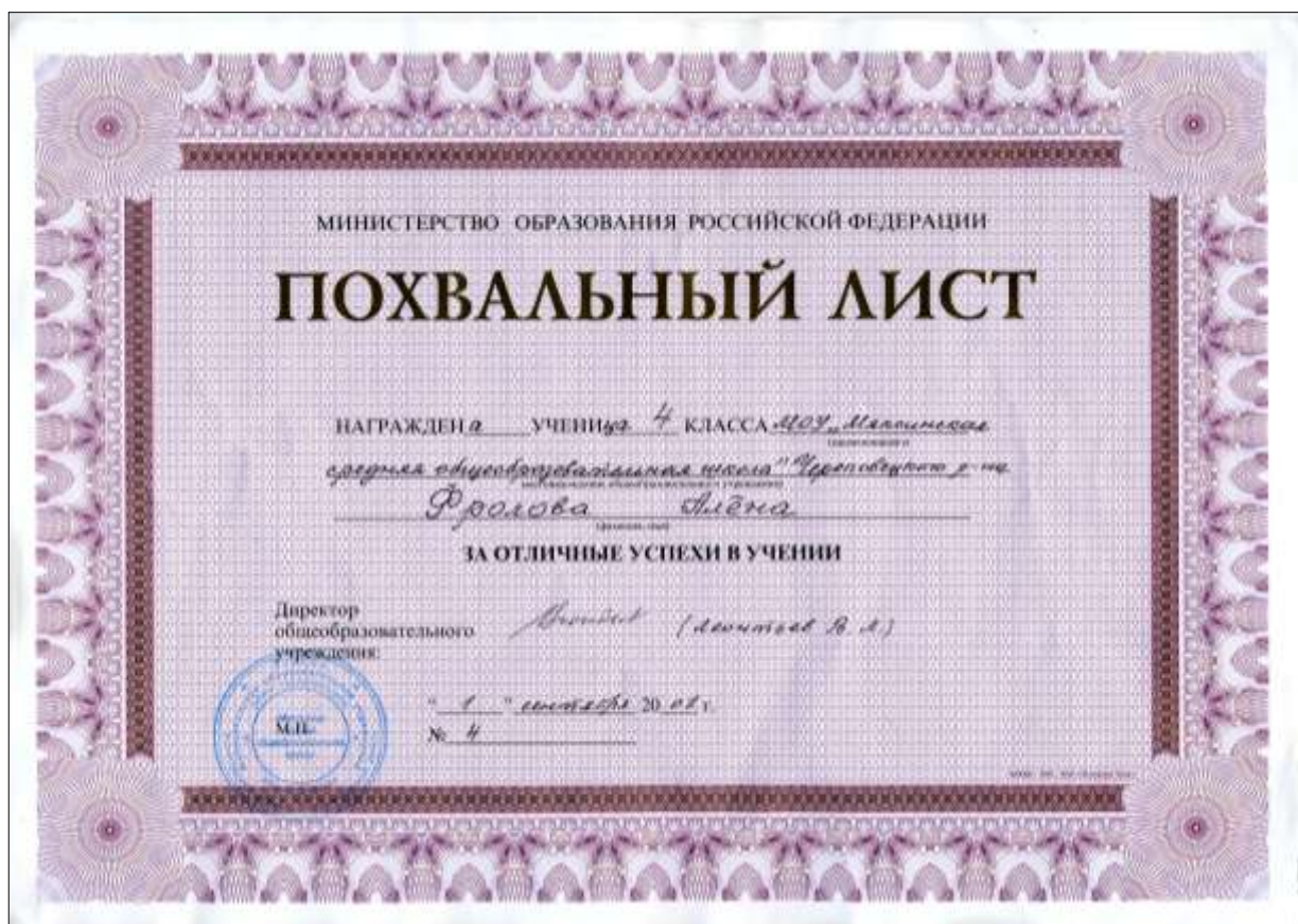
Рис 1 Похвальный лист Фроловой Алены