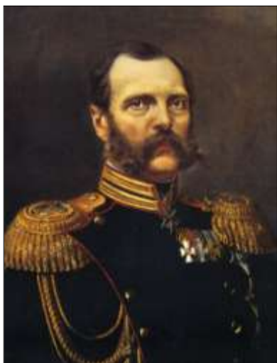
Рис.1. Александр Второй.