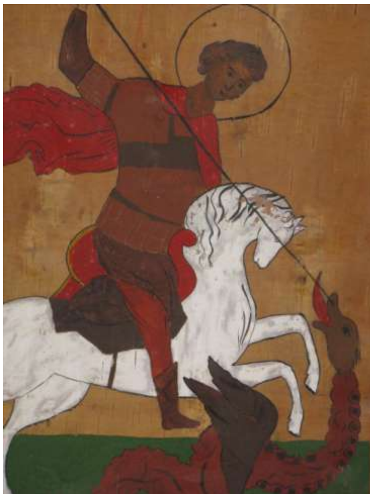
21. Святой Георгий Победоносец, побеждающий змея. Часть хоругви спектакля «Егорьевский праздник».