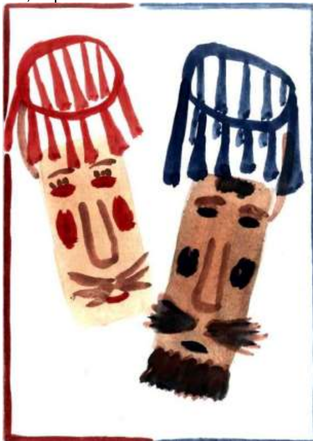
18. Лицевая часть программки фольклорного спектакля «Солнышко-ведрышко».