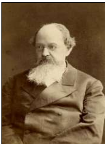
Рис. 5. Кавелин Константин Дмитриевич