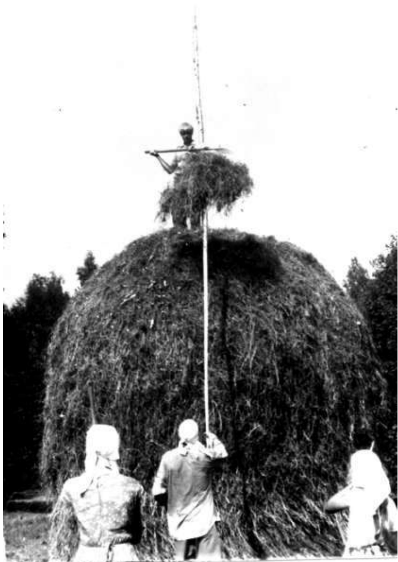
14. На сенокосе в деревне Работино. 1980-е гг. На стогe – В.Козинов. Сено подает Р.М.Смирнов.