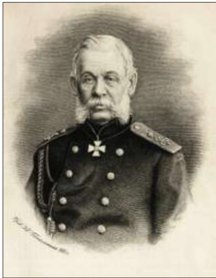
Рис.7. Милютин Дмитрий Алексеевич