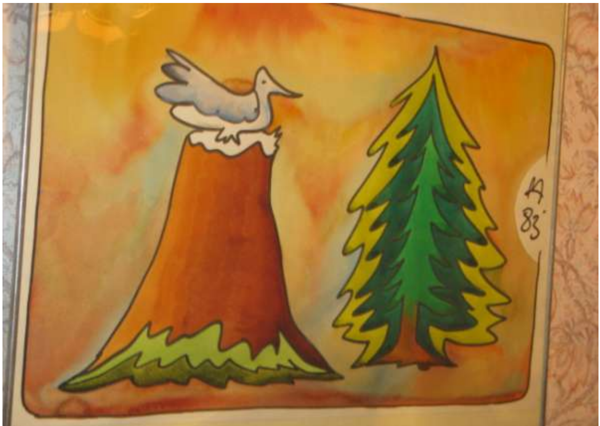
12. А.С.Абрамов «Птица и дерево». Бумага, фломастеры.