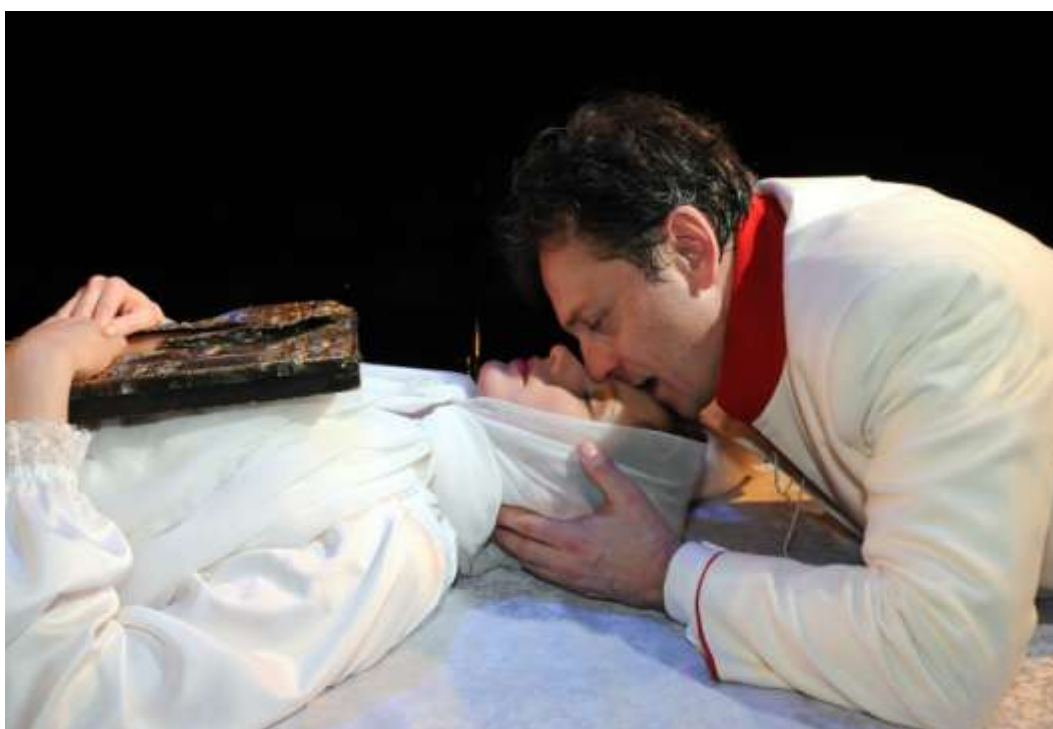
26.Ф.М.Достоевский «Кроткая» (2008 г.). Фрагмент спектакля.