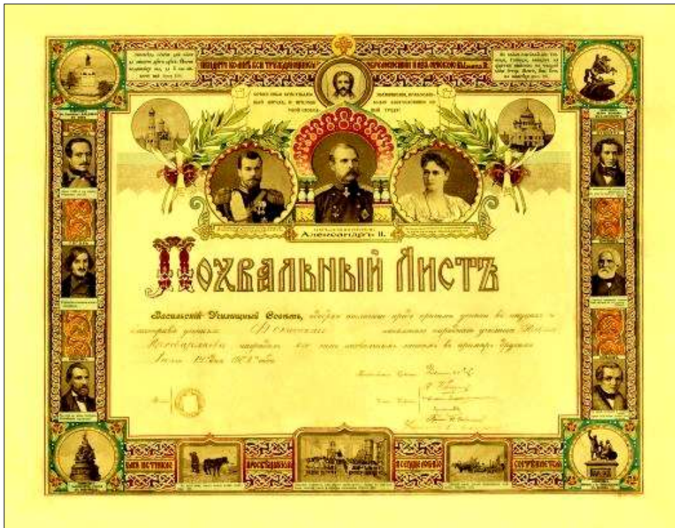
Рис.1. Похвальный лист 1913 года (вспомогательный фонд – распечатан из Интернета)