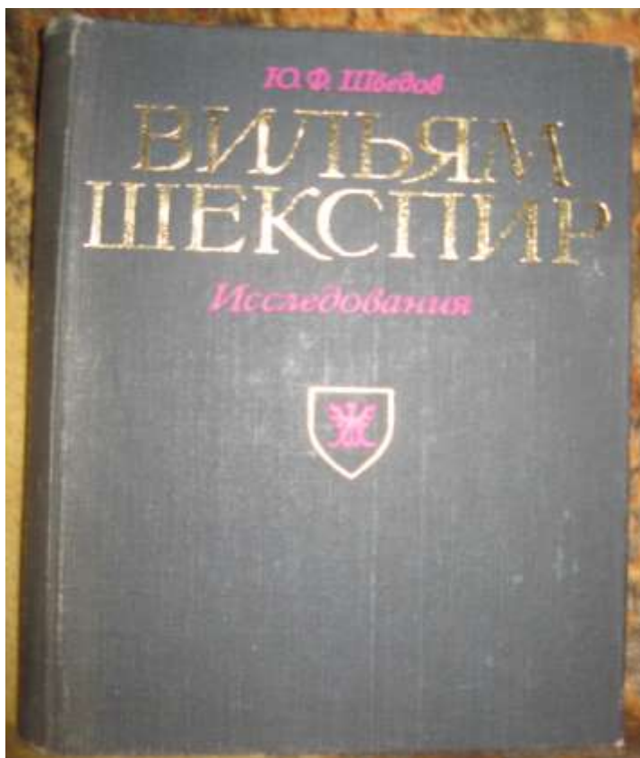
4. Книга Ю.Ф.Шведова о Шекспире.