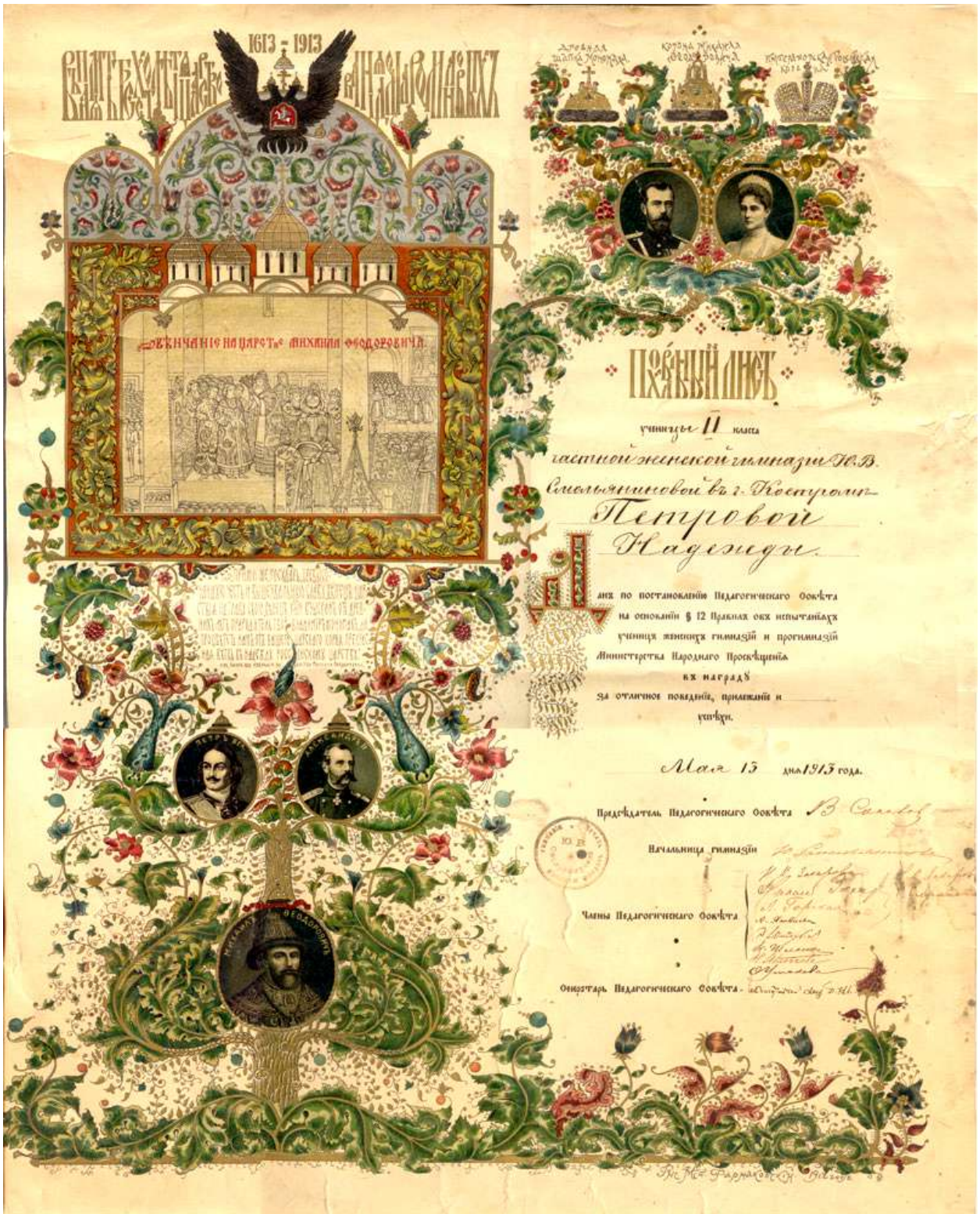
Рис.3. Похвальный лист 1913 года (вспомогательный фонд – распечатан из Интернета)