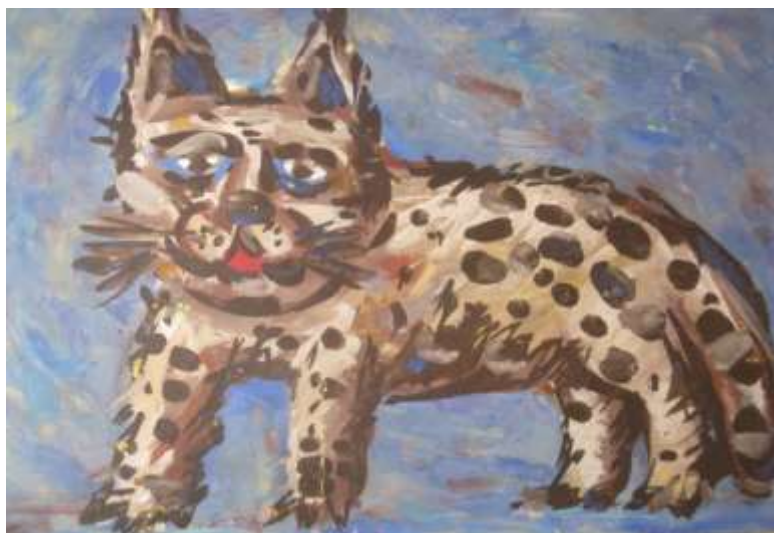
13. А.С.Абрамов «Кот муаровый». Бумага, фломастеры.