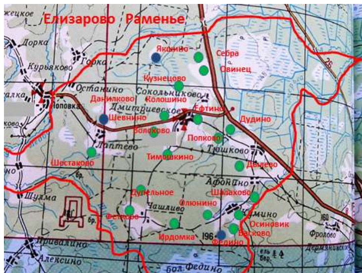
Рис.4 Населенные пункты XVI в. на территории Елизарова Раменья

Комплексное использование данных способов позволило восстановить на территории бывшей вотчины Кирилло-Белозерского монастыря Елизарово Раменье предполагаемое местоположение 9 из 11 деревень и 25 из 42 пустошей XVI в. Некоторые результаты реконструкции местоположения приведены на карте (рис.4).