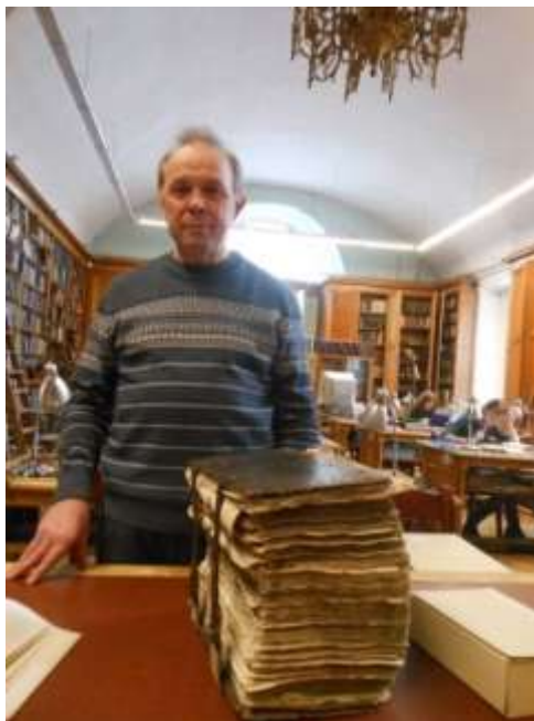
Рис.2. Работа с рукописями XV – XVII вв. в Российской национальной библиотеке.

историю возникновения села Елизарова Раменья (Дмитриевского) и окружающих его деревень. Но подробное рассмотрение истории села и вотчины не входит в тематику данной статьи, поэтому будет рассмотрено в последующих публикациях.